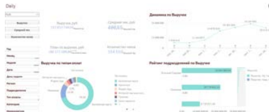
Дашборд «Анализ данных по продажам» (на скриншоте представлены тестовые данные)